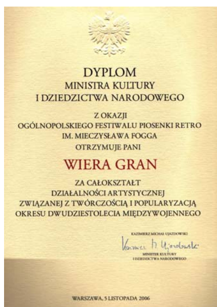
Honorowy dyplom Ministra Kultury